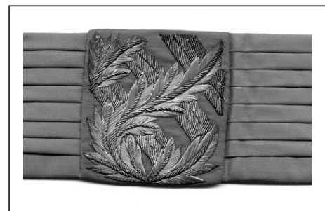
Ejemplar de 1843

En 1792 disponía Carlos IV: “Queriendo el Rey que á los Oficiales Generales de su Ejército se les guarde el debido decoro en qualquier trage que vayan (pues no su Real voluntad precisarlos á que vistan siempre el uniforme) ... se ha servido mandar se pongan sobre qualesquiera vestido ... una faja de tafetán sencillo, ó sarga encarnada, con las divisas ...” . Un ejemplar de esta faja, pero de brigadier de 1843, ha tenido entrada recientemente en el Museo, donada por el teniente coronel Félix Gálvez.